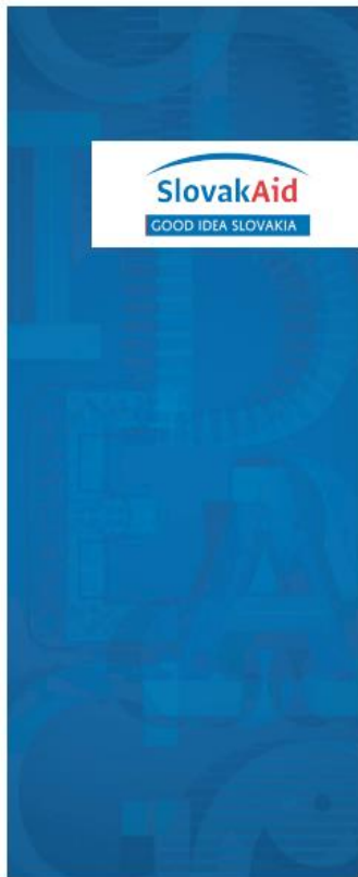
Roll up pre SlovakAid